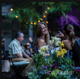
HDS / ZAMP