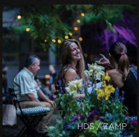
HDS / ZAMP