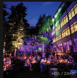
HDS / ZAMP