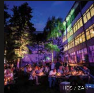
HDS / ZAMP