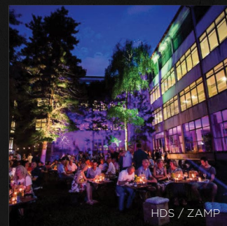
HDS / ZAMP