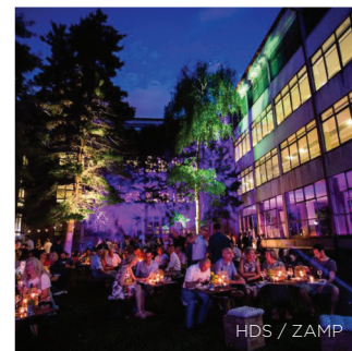
HDS / ZAMP