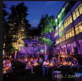
HDS / ZAMP